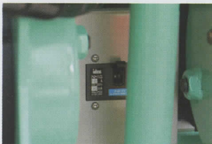
② ブレーカースイッチ