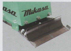
サイドカッター付